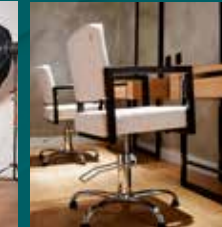
Visagie- en kleedruimte